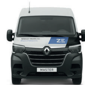
RENAULT TRUCKS MASTER Z.E.