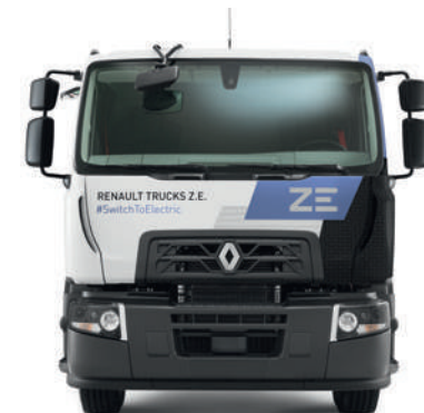
RENAULT TRUCKS D WIDE Z.E.