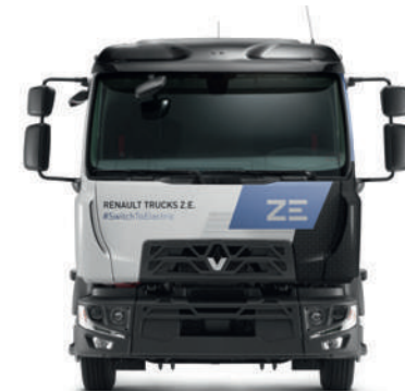
RENAULT TRUCKS D Z.E.